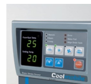
Minuteur et thermostat d'ambiance digital