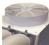
Sortie d'air chaud