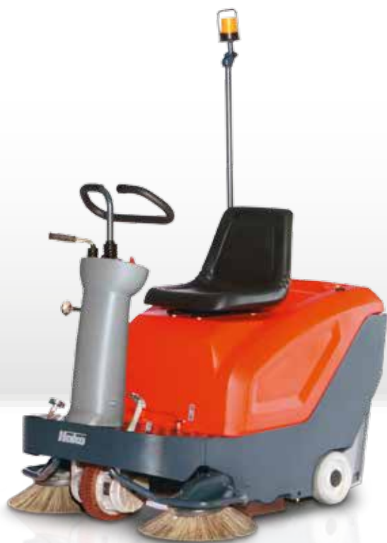
Sweepmaster B800 R