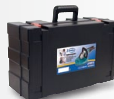
Maletín de transporte